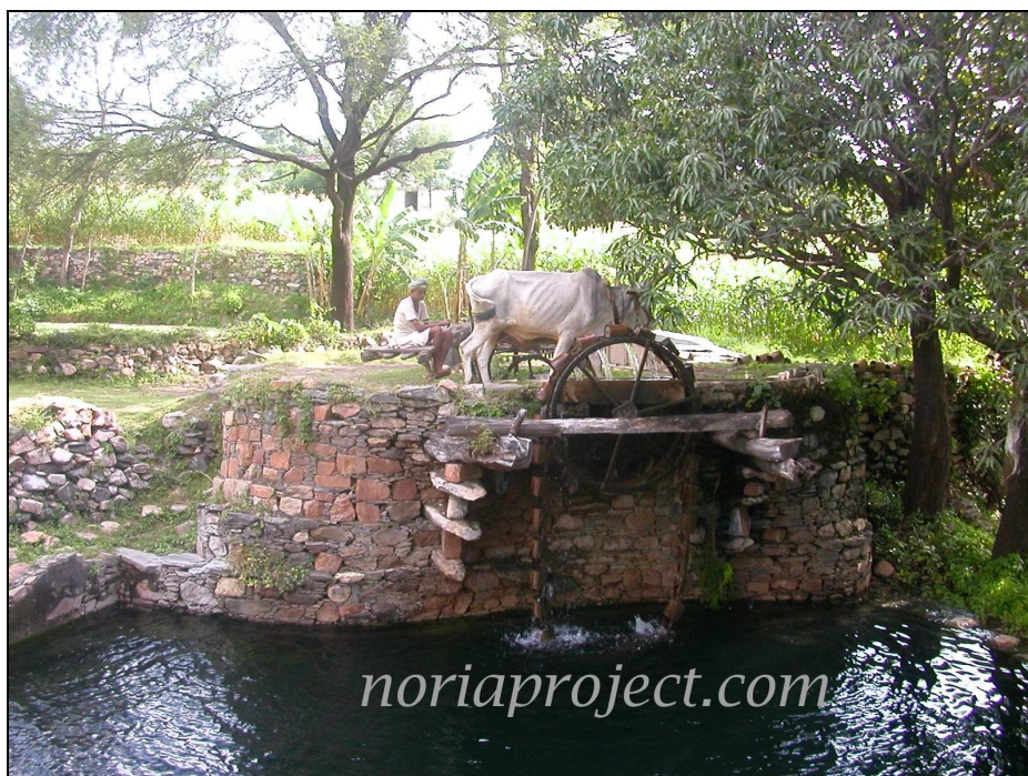
Kumbhalgarh, Inde, 2003